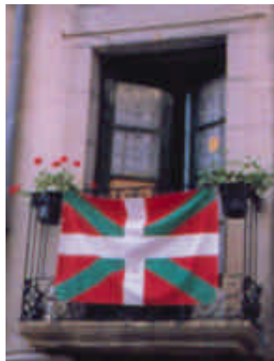
Den baskiska flaggan på en balkong i Pamplona, Navarra